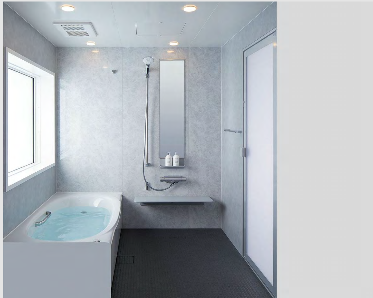
写真はカタログによるイメージです。見積り内容とは異なりますので、ご注意ください。